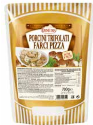
PORCINI TRIFOLATI FARCI PIZZA DEMETRA Busta gr.700