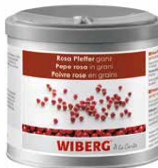
PEPE ROSA IN GRANI WIBERG ml.470