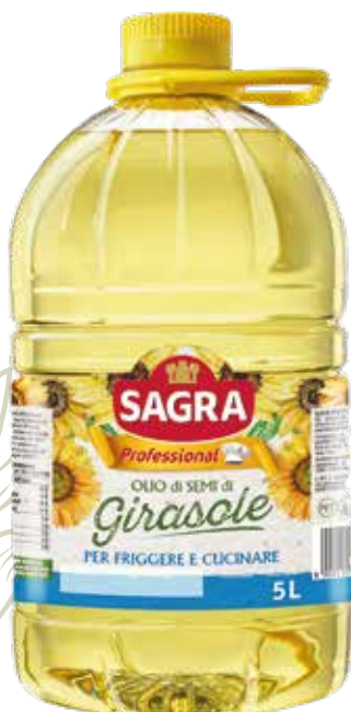
OLIO DI SEMI DI GIRASOLE SAGRA lt.5x2