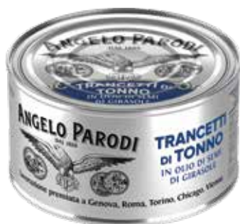
TRANCETTI DI TONNO IN OLIO DI SEMI DI GIRASOLE Latta gr.1000