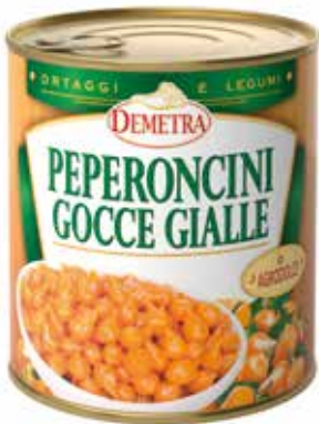
PEPERONCINI GOCCE GIALLE IN AGRODOLCE DEMETRA Netto gr.793