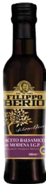
ACETO BALSAMICO FILIPPO BERIO cl.25x6