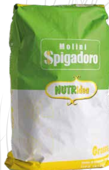
INTEGRALE GROSSA MOLINI SPIGADORO Farina di grano tenero tipo integrale w 230/260 Sacco kg.25