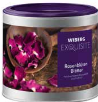
PETALI DI ROSA WIBERG ml.470