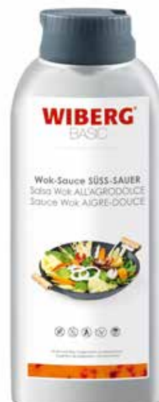
SALSIA WOK AGRODOLCE WIBERG Netto gr.800