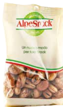
FAVE INTERE SALATE ALPE gr.350