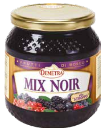
MIX NOIR ALLO SCIROPPO DEMETRA ml.580