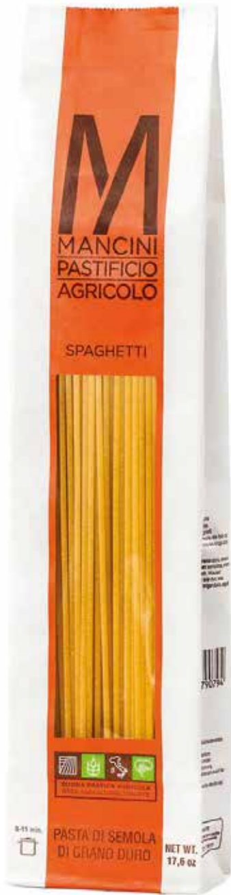
SPAGHETTI MANCINI kg.1x6