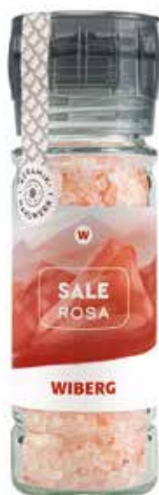
MACININO MONOUSO SALE ROSA WIBERG Netto gr.112