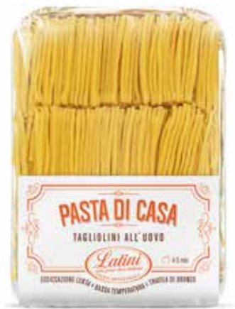
TAGLIOLINI ALL'UOVO PASTA DI CASA LATINI gr.500x6