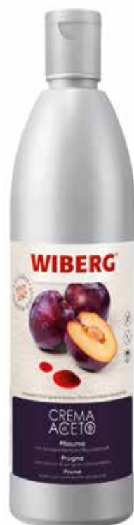
CREMA DI ACETO PRUGNA WIBERG Netto ml.610