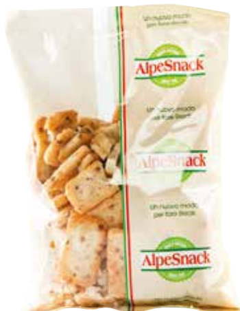
SOY CRACKERS ALPE gr.500