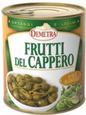
FRUTTI DEL CAPPERO IN OLIO DI GIRASOLE DEMETRA Netto gr.780