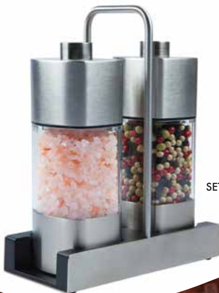
SET MACININI SALE PEPE DEMETRA