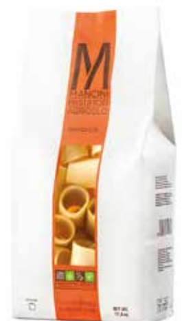
PACCHERI MANCINI kg.1x6