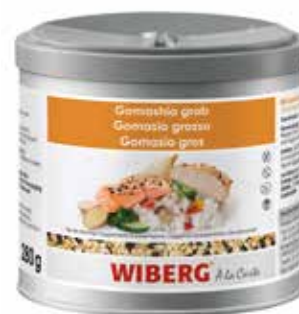
GOMASIO GROSSO WIBERG ml.470