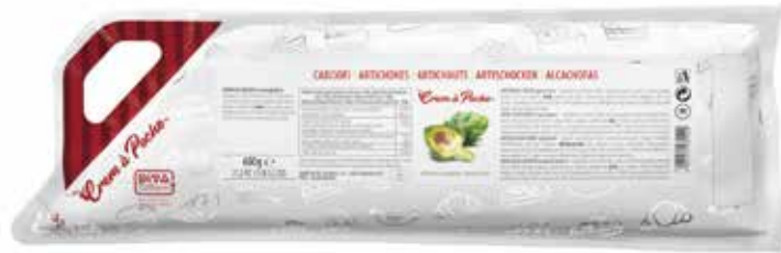
CREM A POCHE CARCIOFI DEMETRA gr.600