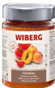
CHUTNEY ALBICOCCA - POMODORO WIBERG gr.390