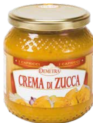
CREMA DI ZUCCA DEMETRA Vaso ml.580