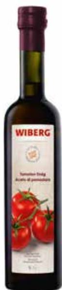
ACETO DI POMODORO WIBERG cl.50