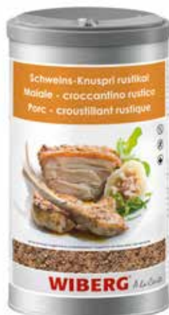
MAIALE CROCCANTINO RUSTICO WIBERG ml.1200