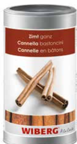
CANNELLA IN BASTONCINI WIBERG ml.1200