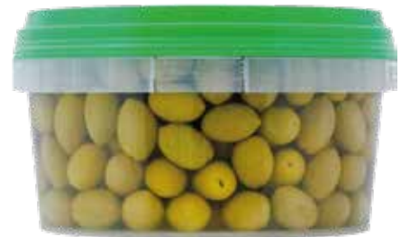
OLIVE VERDI MEDIE TEMPERA kg.2