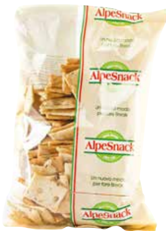
PIZZA CROCCANTE AL ROSMARINO ALPE gr.350