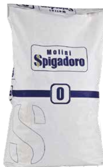
FARINA BIANCA 0 MOLINI SPIGADORO Farina di grano tenero tipo "0" w 240/270 Sacco kg.25