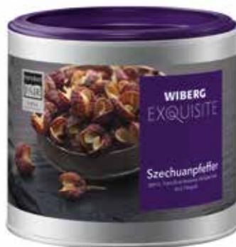
PEPE DI SICHUAN WIBERG ml.470