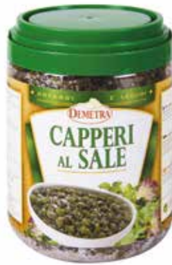
CAPPERI AL SALE DEMETRA Netto gr.1000