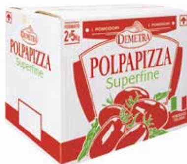
POLPAPIZZA POLPA DI POMODORO SUPERFINE DEMETRA kg.5x2