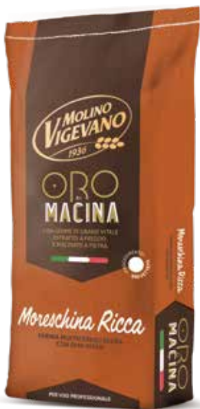
MORESCHINA RICCA MOLINO VIGEVANO Farina multicereali scura con semi e germe di grano w 270/290 Sacco kg.10