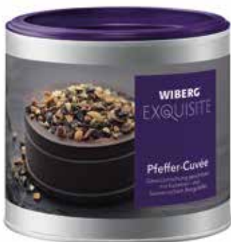
PEPE CUVÉE MIX DI SPEZIE WIBERG ml.470