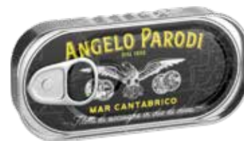
FILETTI DI ACCIUGHE CANTABRICO gr.50x24