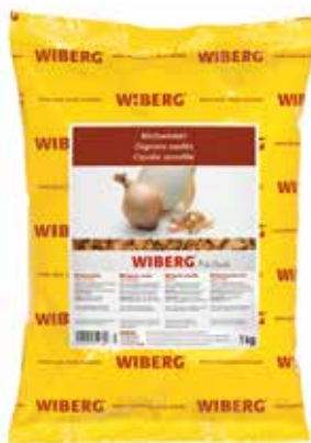
CIPOLLE ARROSTITE TRITATE WIBERG Netto gr.1000