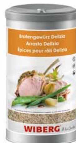
ARROSTO DELIZIA WIBERG ml.1200