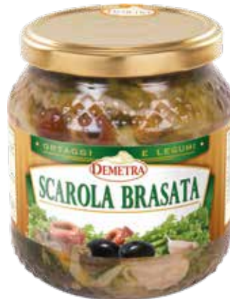
SCAROLA BRASATA DEMETRA Vaso ml.580