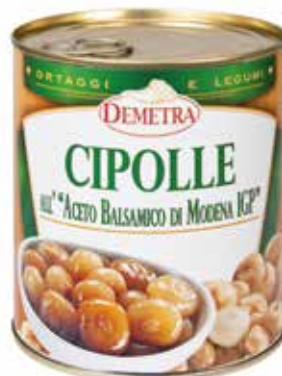
CIPOLLE ALL'ACETO BALSAMICO DI MODENA IGP DEMETRA Netto gr.850