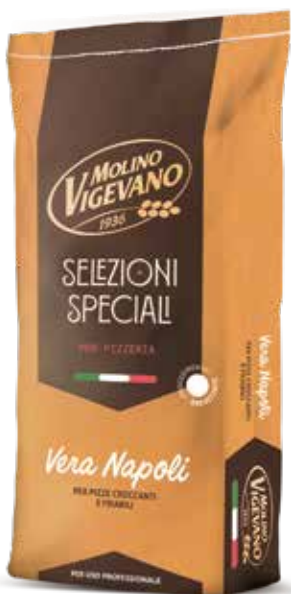
VERA NAPOLI MOLINO VIGEVANO Farina di grano tenero tipo "0" e semola rimacinata w 250/270 Sacco kg.25