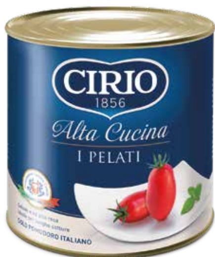
POMODORO I PELATI - CIRIO Netto kg.2,5