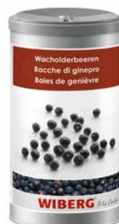
BACCHE DI GINEPRO WIBERG ml.1200