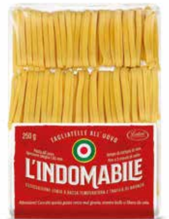
TAGLIATELLE ALL'UOVO L'INDOMANIBILE LATINI gr.250x12