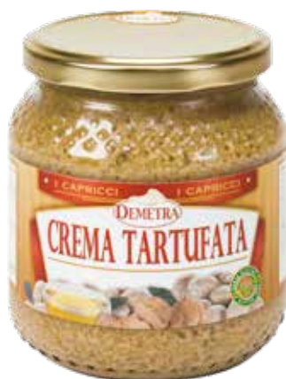
CREMA TARTUFATA TOSCANA DEMETRA Vaso ml.580