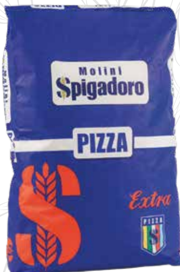
PIZZA EXTRA MOLINI SPIGADORO Farina di grano tenero tipo "00" w 350/380 Sacco kg.25