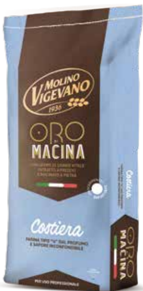
COSTIERA MOLINO VIGEVANO Farina di grano tenero tipo "0" con germe di grano w 290/230 Sacco kg.25