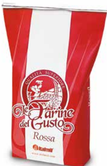
LE FARINE DEL GUSTO ROSSA Farina di grano tenero tipo "00" per lievitazioni medio lunghe Sacco kg.25