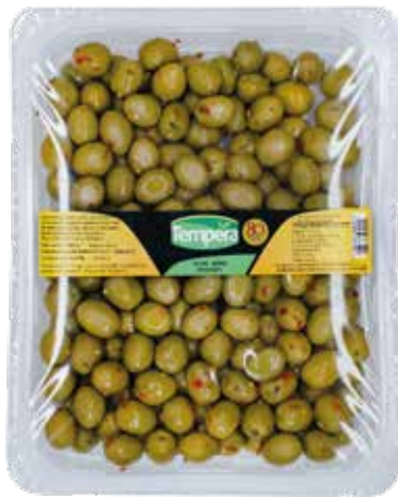
OLIVE VERDI PICCANTI SOTTOVUOTO TEMPERA kg.1