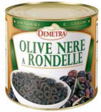
OLIVE NERE A RONDELLE DEMETRA Netto gr.2500