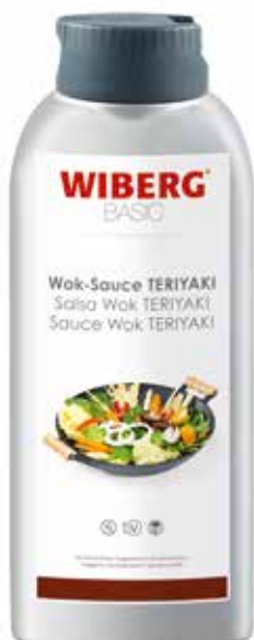
SALSIA WOK TERYAKI WIBERG Netto gr.800