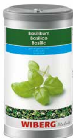
BASILICO LIOFILIZZATO WIBERG ml.1200