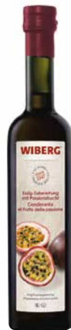
CONDIMENTO AL FRUTTO DELLA PASSIONE WIBERG cl.50