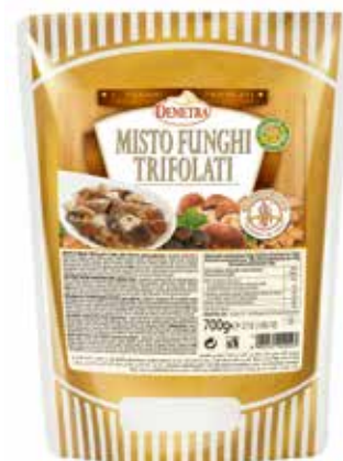
MISTO FUNGHI TRIFOLATI C'ERA UNA VOLTA DEMETRA Busta gr.700