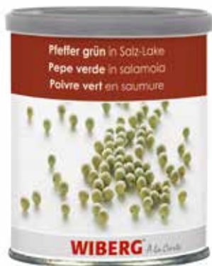
PEPE VERDE IN SALAMOIA WIBERG Netto gr.800