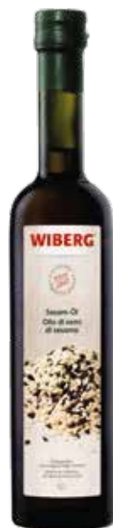
OLIO DI SEMI DI SESAMO WIBERG cl.50