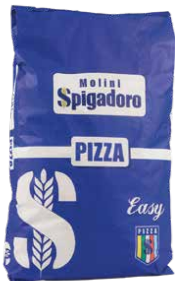
PIZZA EASY MOLINI SPIGADORO Farina di grano tenero tipo "00" w 300/340 Sacco kg.25