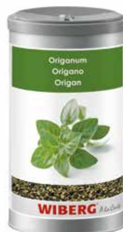
ORIGANO ESSICCATO WIBERG ml.1200