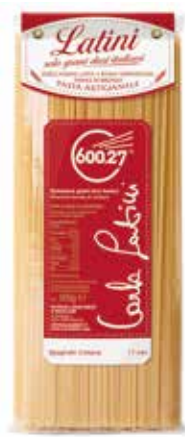
SPAGHETTI CHITARRA LATINI gr.500x12