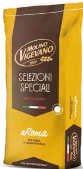
AROMA MOLINO VIGEVANO Farina di grano tenero tipo "0" Farina di riso, semola rimacinata di grano duro w 330/360 Sacco kg.10