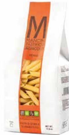
PENNE MANCINI kg.1x6