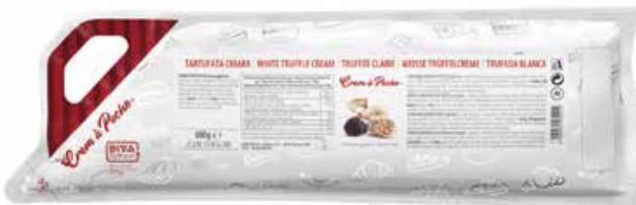
CREM A POCHE TARTUFATA CHIARA DEMETRA gr.600