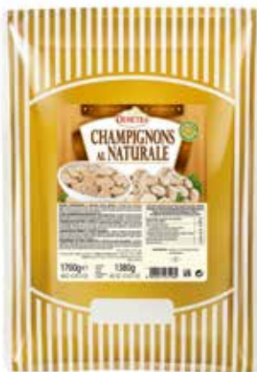
CHAMPIGNONS AL NATURALE DEMETRA Busta kg.1,7