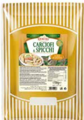
CARCIOFI A SPICCHI IN OLIO DI GIRASOLE DEMETRA Busta kg.1,7