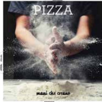
COPERCHIO QUADRATO cm 33x33 Tutti i coperchi sono personalizzabili