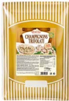
CHAMPIGNONS TRIFOLATI PRIMA SCELTA DEMETRA Busta kg.1,7