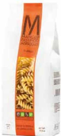
FUSILLI MANCINI kg.1x6