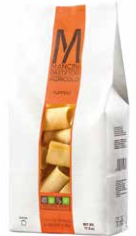
TUFFOLI MANCINI kg.1x6