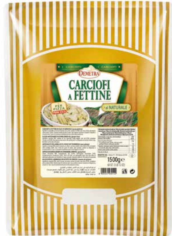
CARCIOFI A FETTINE AL NATURALE DEMETRA Busta kg.1,5