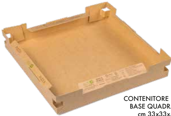
CONTENITORE PIZZA BASE QUADRATA cm 33x33x4