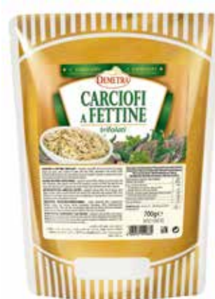
CARCIOFI A FETTINE TRIFOLATI DEMETRA Busta gr.700