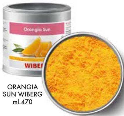
ORANGIA SUN WIBERG ml.470