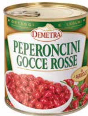
PEPERONCINI GOCCE ROSSE IN AGRODOLCE DEMETRA Netto gr.793