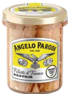
FILETTI DI TONNO IN OLIO DI OLIVA gr.195