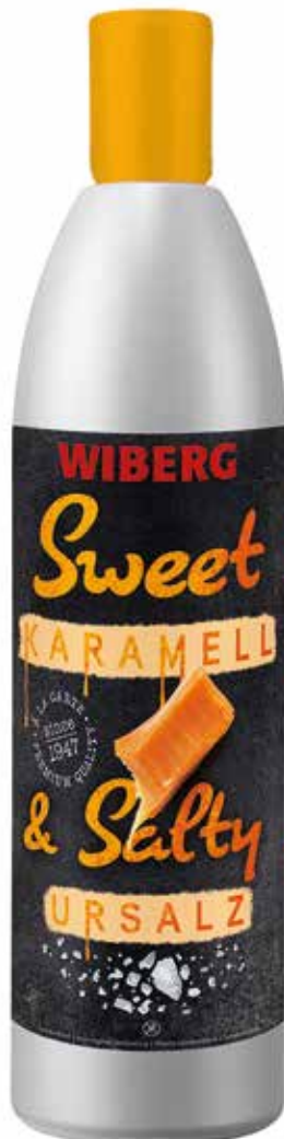
SWEET & SALTY CAMELLO E SALGEMMA WIBERG Netto ml.590