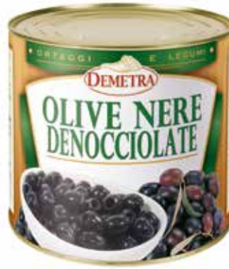
OLIVE NERE DENOCCIOLATE DEMETRA Netto gr.2500