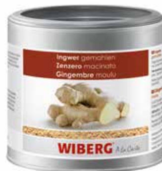
ZENZERO MACINATO WIBERG ml.470