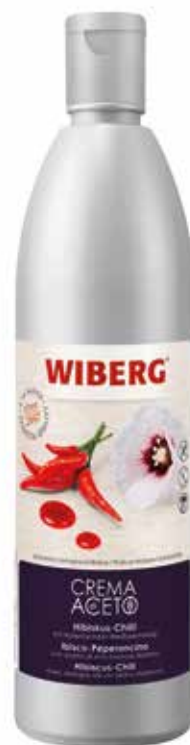
CREMA DI ACETO BISCO - PEPERONCINO WIBERG Netto ml.610