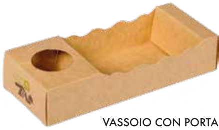
VASSOIO CON PORTABEVANDE cm 21.5x9x4.5