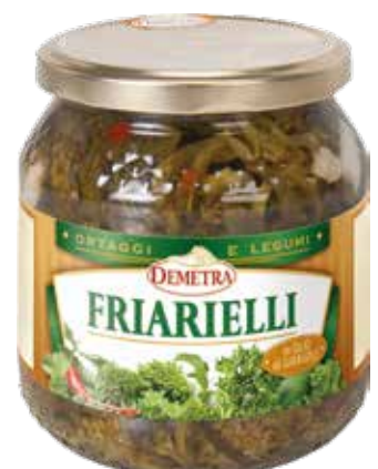
FRIARIELLI IN OLIO DI GIRASOLE DEMETRA Vaso ml.580