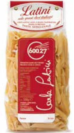
PENNE LATINI gr.500x12