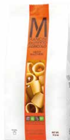
MEZZI PACCHERI MANCINI kg.1x6