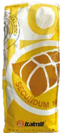
ENERPIZZA LIEVITO NATURALE MADRE kg.1