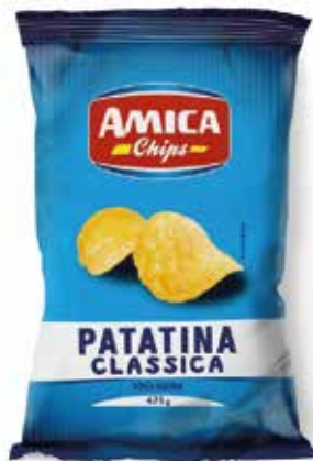
PATATINE AMICA gr.285x8 gr.475x5