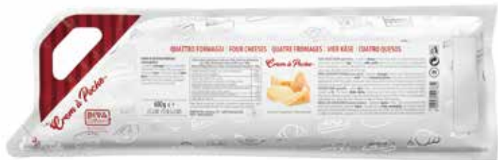
CREM A POCHE QUATTRO FORMAGGI DEMETRA gr.600