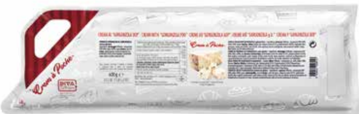
CREM A POCHE GORGONZOLA DOP DEMETRA gr.600