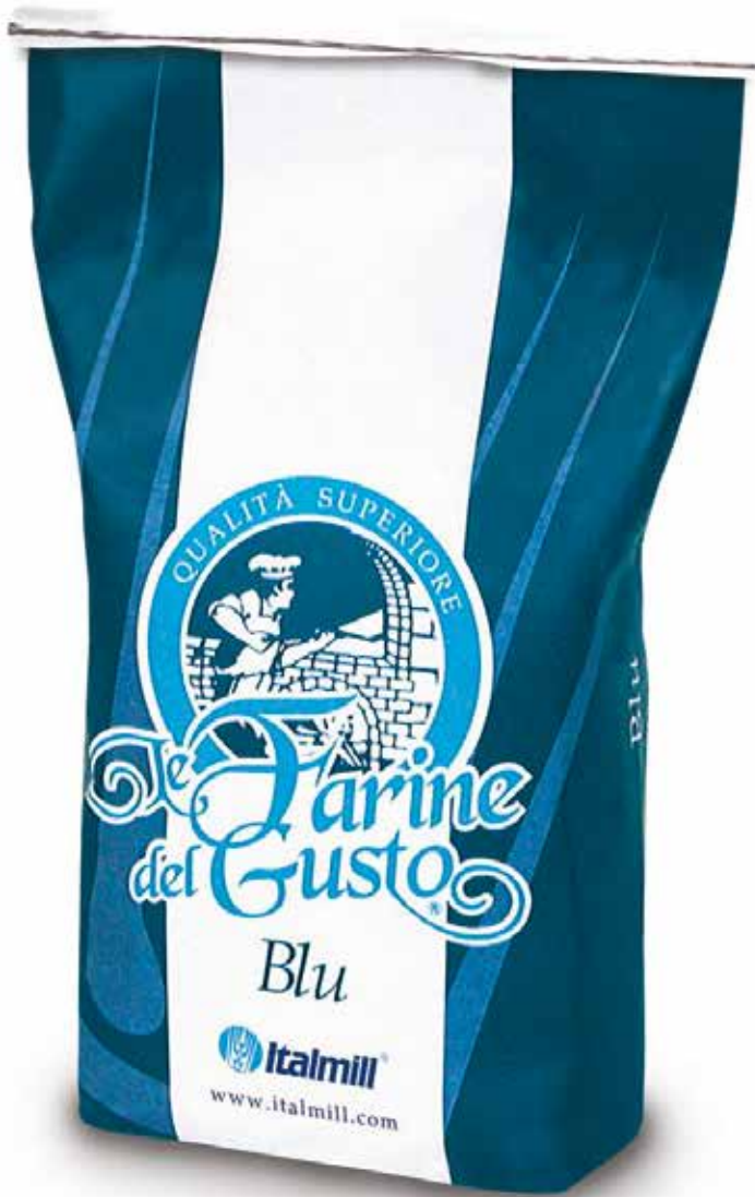
LE FARINE DEL GUSTO BLU Farina di grano tenero tipo "00" per lievitazioni medie Sacco kg.25