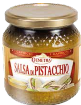
SALSA DI PISTACCHIO DEMETRA Vaso ml.580