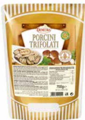
PORCINI TRIFOLATI A FETTE C'ERA UNA VOLTA DEMETRA Busta gr.700