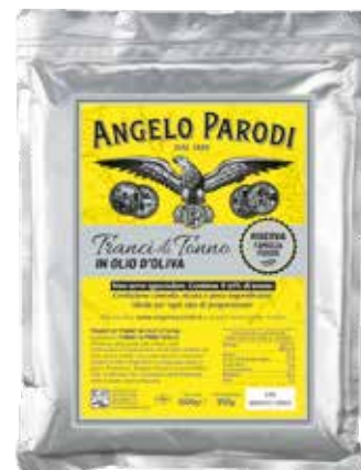
TRANCI DI TONNO IN OLIO DI OLIVA Busta gr.1000