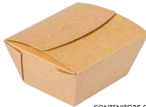
CONTENITORE CON COPERCHIO INTEGRATO (inf.) cm 10.2x8.4 | (sup.) cm 13.7x12.3 x6.5h