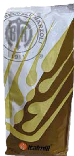
FARINA NUCLEO MULTICERALEI Sacco kg.1