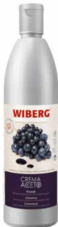
CREMA DI ACETO CLASSICA WIBERG Netto ml.610