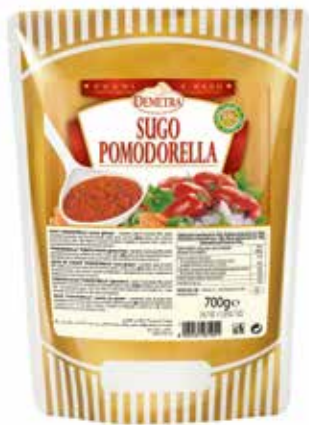
SUGO POMODORELLA DEMETRA Busta gr.700