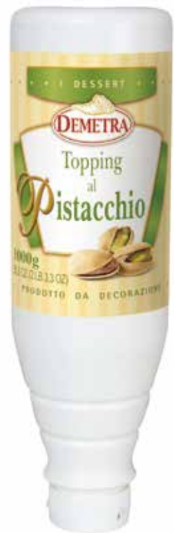
TOPPING AL PISTACCHIO DEMETRA kg.1