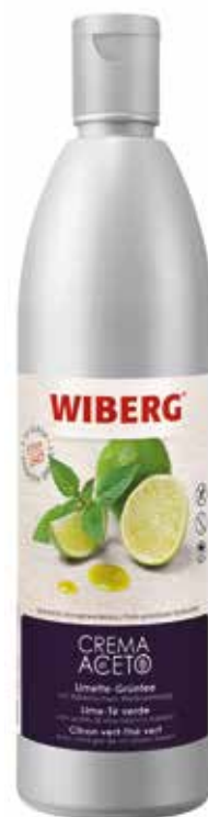
CREMA DI ACETO LIME - TE' VERDE WIBERG Netto ml.610