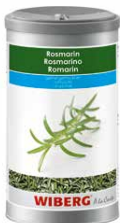
ROSMARINO LIOFILIZZATO WIBERG ml.1200