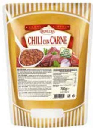
CHILI CON CARNE DEMETRA Busta gr.700