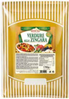
VERDURE ALLA ZINGARA DEMETRA Busta kg.1,7