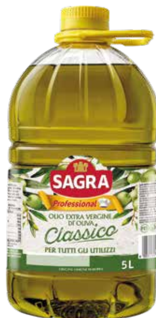
OLIO EXTRA VERGINE DI OLIVA SAGRA lt.5x2