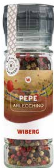
MACININO MONOUSO PEPE ARLECCHINO WIBERG Netto gr.43