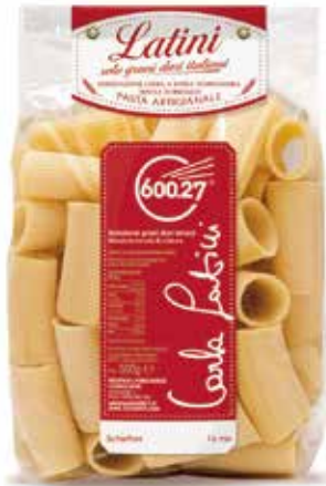
SCHIAFFONI LATINI gr.500x12