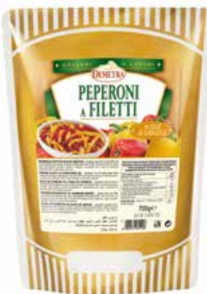
PEPERONI A FILETTI IN OLIO DI GIRASOLE DEMETRA Busta gr.700