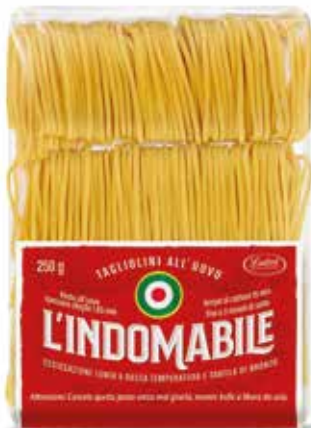
TAGLIOLINI ALL'UOVO L'INDOMANIBILE LATINI gr.250x12