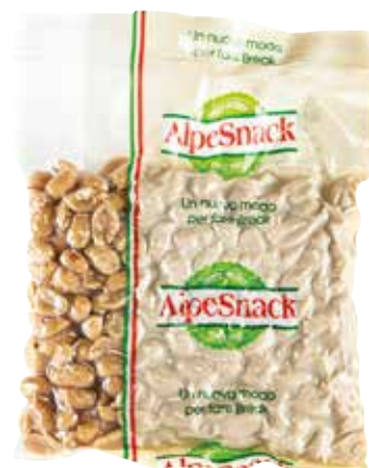
ARACHIDI ALPE gr.1000