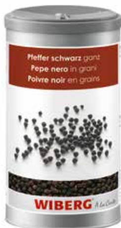
PEPE NERO IN GRANI WIBERG ml.1200