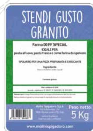
STENDI GUSTO GRANITO MOLINI SPIGADORO Farina di grano tenero tipo "00" Sacco kg.5