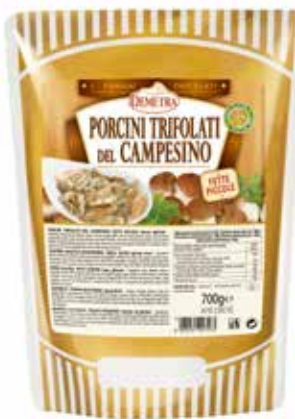
PORCINI TRIFOLATI DEL CAMPESINO DEMETRA Busta gr.700