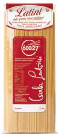
TRENETTE LATINI gr.500x12