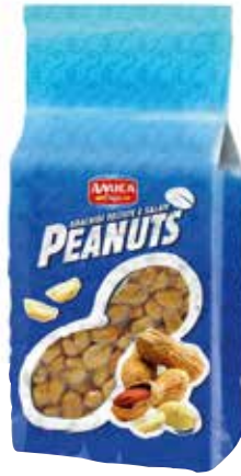
ARACHIDI AMICA kg.1x8