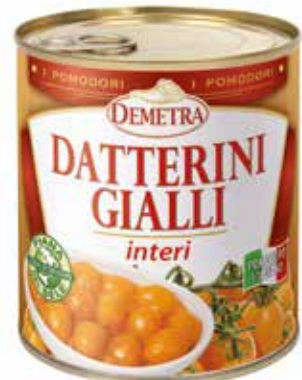
DATTERINI GIALLI INTERI DEMETRA Netto gr.800