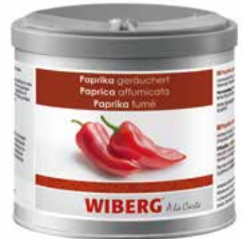
PAPRIKA AFFUMICATA WIBERG ml.470