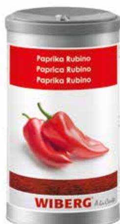
PAPRIKA RUBINO DELICATA WIBERG ml.1200