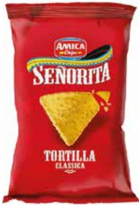
TORTILLA CLASSICA AMICA gr.400