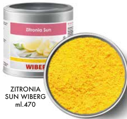
ZITRONIA SUN WIBERG ml.470