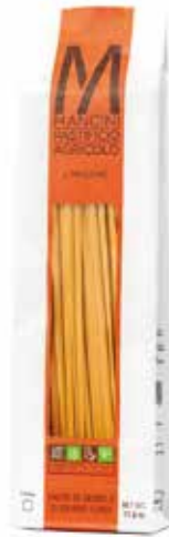
LINGUINE MANCINI kg.1x6