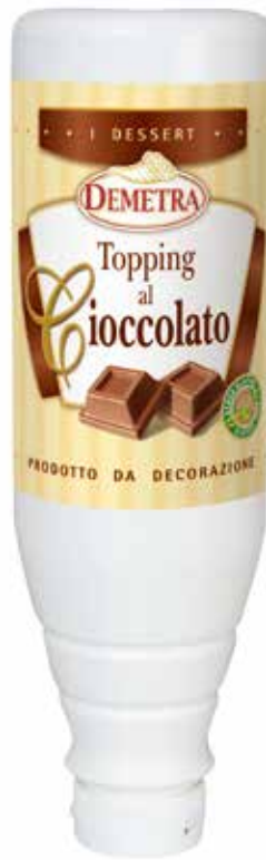
TOPPING AL CIOCCOLATO DEMETRA kg.1