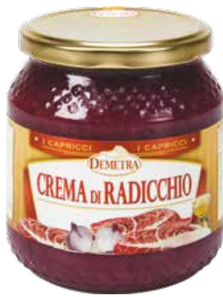
CREMA AL RADICCHIO DEMETRA Vaso ml.580