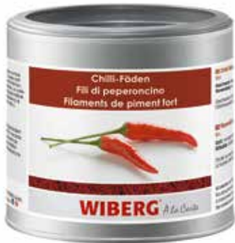
FILI DI PEPERONCINO WIBERG ml.470