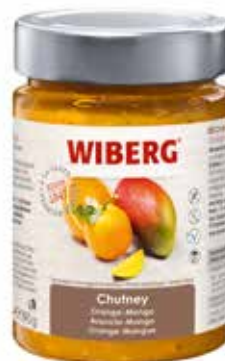
CHUTNEY ARANCIA - MANGO WIBERG gr.390