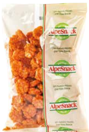
RISO PICCANTE ALPE gr.500