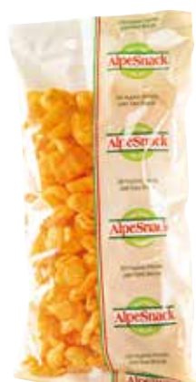
CONI DI MAIS GUSTO BACON ALPE gr.200