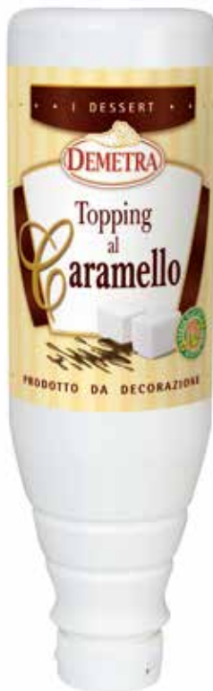
TOPPING AL CARAMELLO DEMETRA kg.1