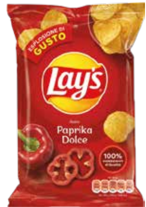
PATATINE PAPRIKA LAY'S gr.44x20