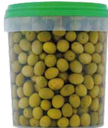
OLIVE VERDI GIGANTI IN SALAMOIA TEMPERA kg.4