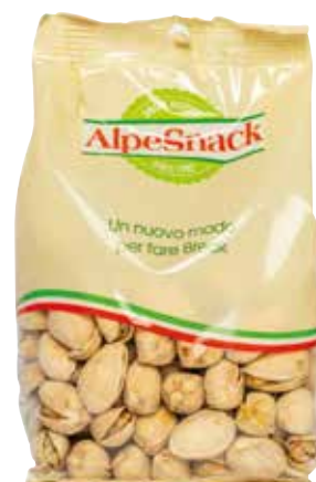
PISTACCHI TOSTATI ALPE gr.650