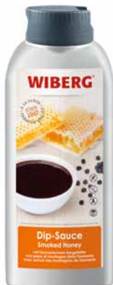
SMOKED HONEY WIBERG Netto gr.800