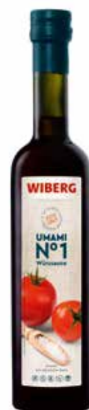
UMAMI N°1 WIBERG cl.50