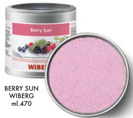
BERRY SUN WIBERG ml.470