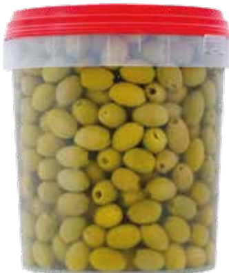
OLIVE VERDI ASCOLANE DENOCCIOLATE TAGLIO TEMPERA kg.3,3