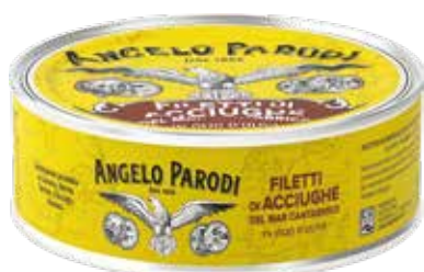
FILETTI DI ACCIUGHE CANTABRICO gr.550