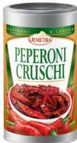
PEPERONI CRUSCHI DEMETRA ml.1200