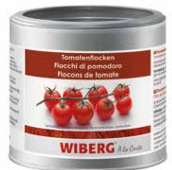
FIOCCHI DI POMODORO WIBERG ml.470