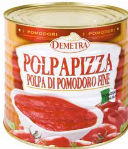
POLPAPIZZA POLPA DI POMODORO FINE DEMETRA Netto kg.2,5