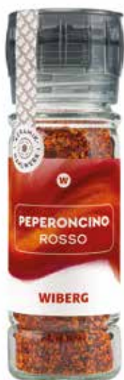
MACININO MONOUSO PEPERONCINO WIBERG Netto gr.40