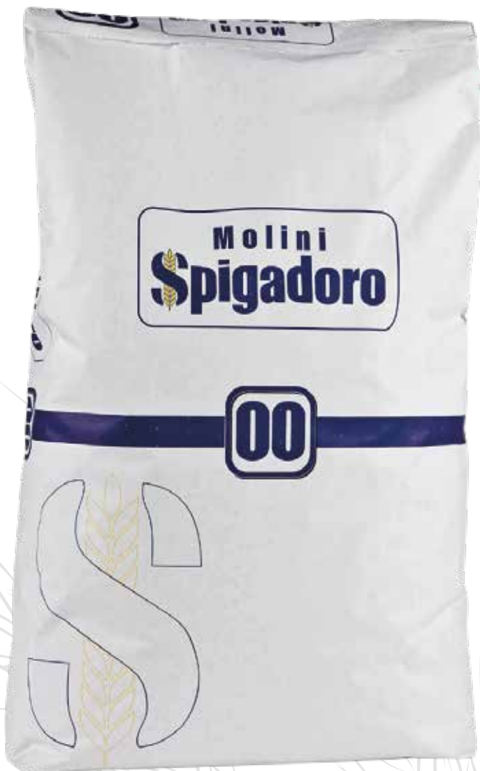
FARINA BIANCA 00 MOLINI SPIGADORO Farina di grano tenero tipo "00" w 240/270 Sacco kg.25