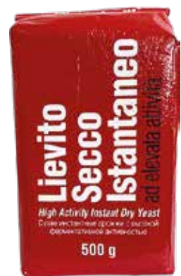
BRAVO LIEVITO Istantaneo gr.500x20