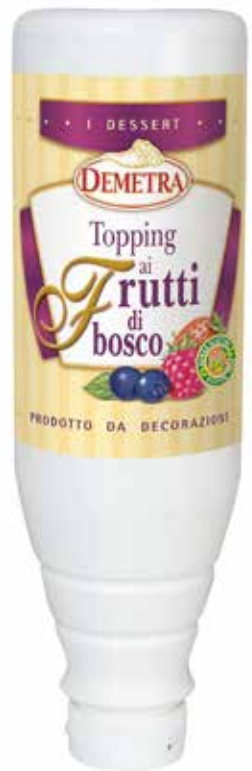
TOPPING AI FRUTTI DI BOSCO DEMETRA kg.1