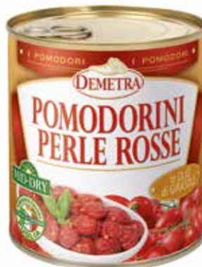
POMODORINI PERLE ROSSE IN OLIO DI GIRASOLE MID-DRY DEMETRA Netto gr.800