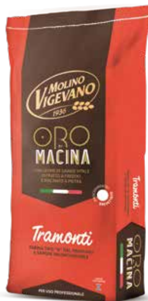
TRAMONTI MOLINO VIGEVANO Farina di grano tenero tipo "0" con germe di grano w 330/360 Sacco kg.25