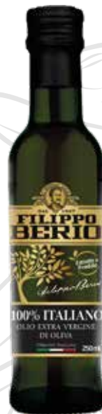
OLIO EXTRA VERGINE DI OLIVA FILIPPO BERIO cl.25x6