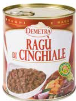
RAGU' DI CINGHIALE DEMETRA Netto gr.820