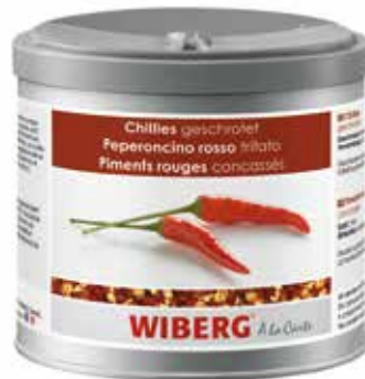
PEPERONCINO ROSSO TRITATO WIBERG ml.470