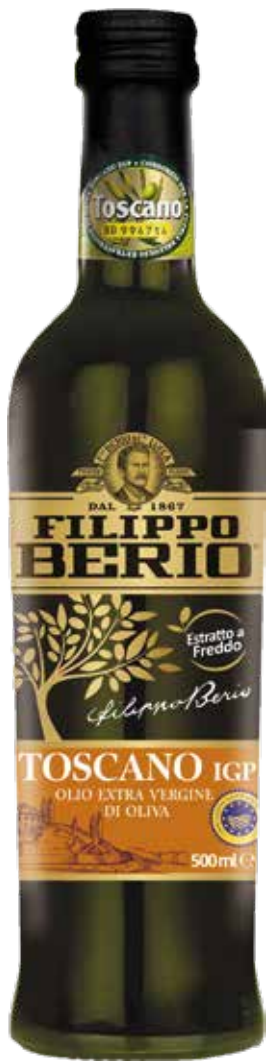
OLIO EXTRA VERGINE 100% TOSCANO FILIPPO BERIO cl.50x6