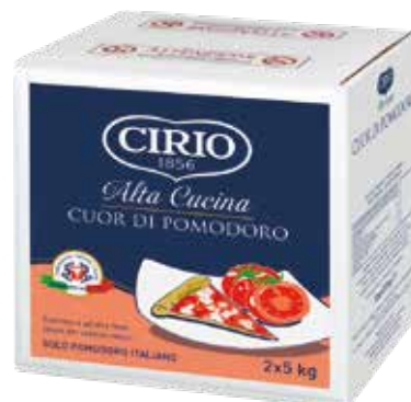
CUOR DI POMODORO - CIRIO kg.5x2