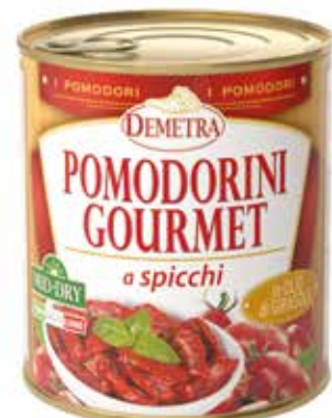
POMODORINI GOURMET A SPICCHI IN OLIO DI GIRASOLE MID-DRY DEMETRA Netto gr.780