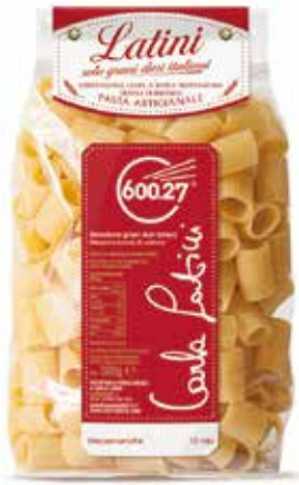
MEZZEMANICHE LATINI gr.500x12