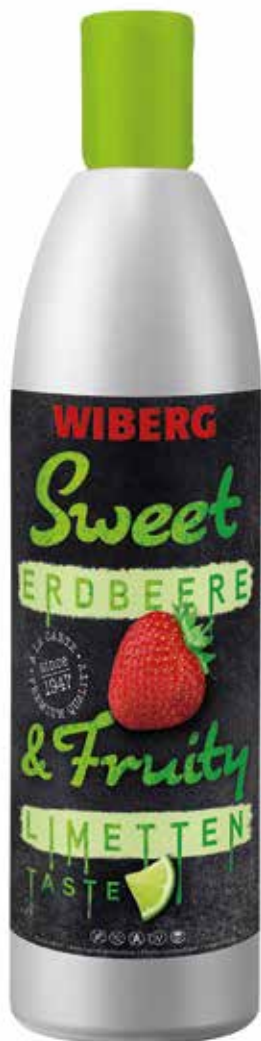
SWEET & FRUITY FRAGOLA E LIME WIBERG Netto ml.633