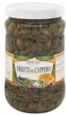
FRUTTI DEL CAPPERO IN ACETO DI VINO DEMETRA Netto gr.1600