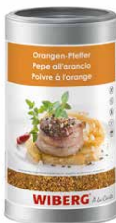
PEPE ALL'ARANCIO WIBERG ml.1200