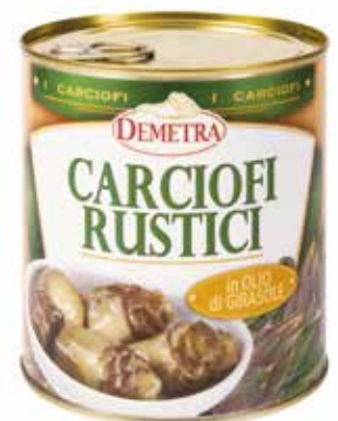
CARCIOFI RUSTICI IN OLIO DI GIRASOLE DEMETRA Netto gr.770