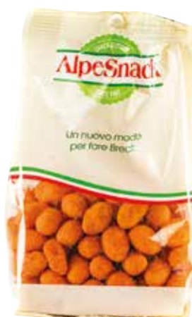
MEFISTO CHILI ALPE gr.400