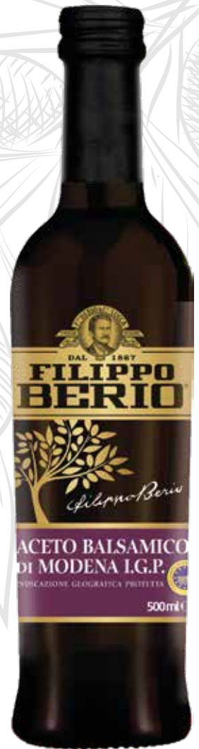
ACETO BALSAMICO FILIPPO BERIO cl.50x6