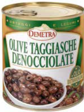
OLIVE TAGGIASCHE DENOCCIOLATE DEMETRA Netto gr.750