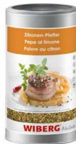
PEPE AL LIMONE WIBERG ml.1200