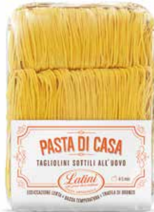
TAGLIOLINI SOTTILI ALL'UOVO PASTA DI CASA LATINI gr.500x6