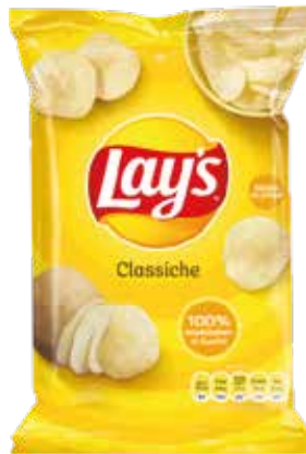
PATATINE CLASSICHE LAY'S gr.44x20