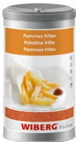
PATATINE FRITTE SALE AROMATICO WIBERG ml.1200