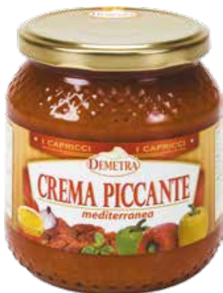
CREMA PICCANTE MEDITERRANEA DEMETRA Vaso ml.580