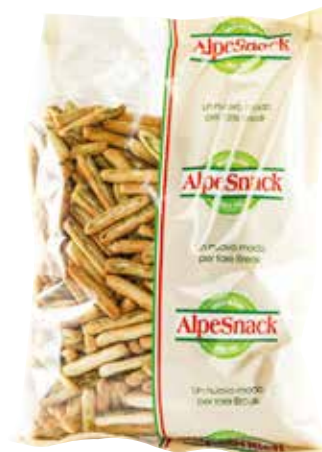
FINEZZE AL PESTO ALPE gr.300