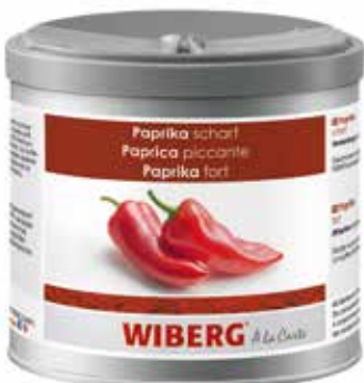
PAPRIKA PICCANTE WIBERG ml.470