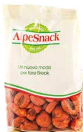
MAIS GIGANTE PICCANTE ALPE gr.500x8