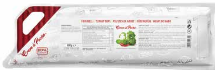
CREM A POCHE FRIARELLI DEMETRA gr.600