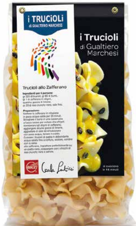
TRUCIOLI GUALTIERO MARCHESI gr.500x12