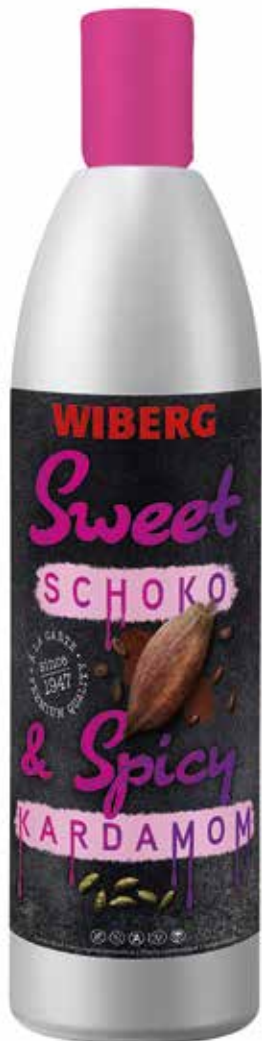
SWEET & SPICY CIOCCOLATO E CARDAMOMO WIBERG Netto ml.580