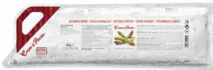
CREM A POCHE ASPARAGI VERDI DEMETRA gr.600