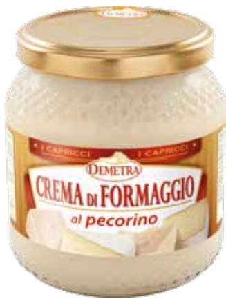
CREMA DI FORMAGGIO AL PECORINO DEMETRA Vaso ml.580