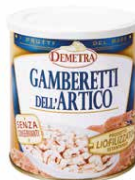
GAMBERETTI DELL'ARTICO LIOFILIZZATI DEMETRA Netto gr.105