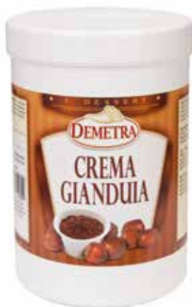
CREMA GIANDUIA DEMETRA Netto gr.1000