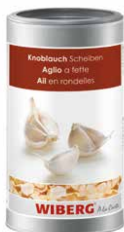
AGLIO A FETTE WIBERG ml.1200