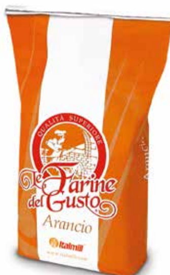
LE FARINE DEL GUSTO ARANCIO Farina di grano tenero tipo "00" per lievitazioni brevi Sacco kg.25