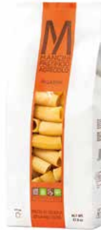
RIGATONI MANCINI kg.1x6