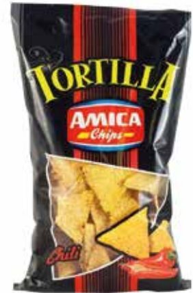
TORTILLA CHILI AMICA gr.400