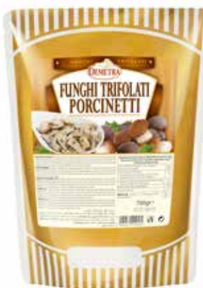
FUNGHI TRIFOLATI PORCINETTI DEMETRA Busta gr.700