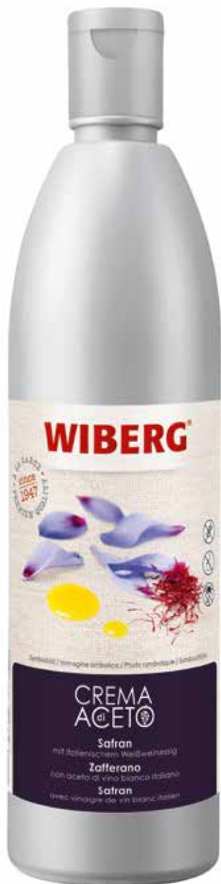
CREMA DI ACETO ZAFFERANO WIBERG Netto ml.610