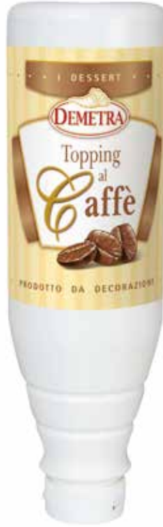
TOPPING AL CAFFÈ DEMETRA kg.1