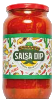
SALSA PUEBLO ALPE ml.950