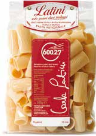
RIGATONI LATINI gr.500x12