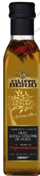
OLIO EXTRA VERGINE OLIVA AL PEPERONCINO FILIPPO BERIO cl.25x6