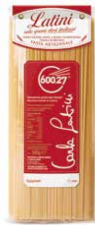
SPAGHETTI LATINI gr.500x12