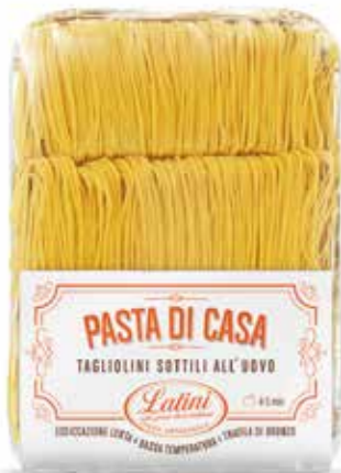
CHITARRA ALL'UOVO PASTA DI CASA LATINI gr.500x6