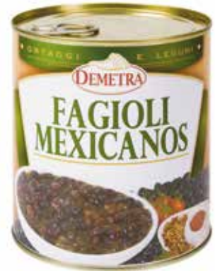
FAGIOLI MEXICANOS DEMETRA Netto gr.900