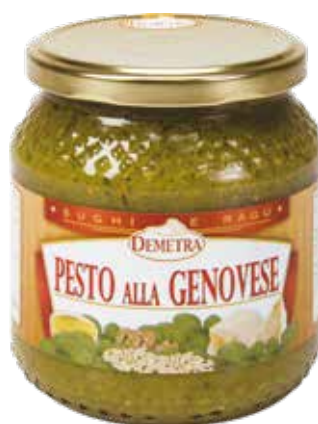
PESTO ALLA GENOVESE DEMETRA Vaso ml.580