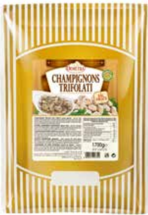
CHAMPIGNONS TRIFOLATI DAL FRESCO DEMETRA Busta kg.1,7