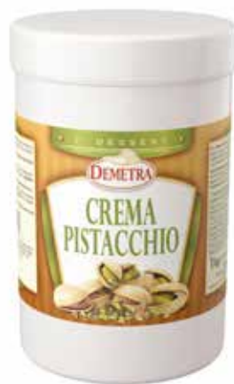
CREMA PISTACCHIO DEMETRA Netto gr.1000