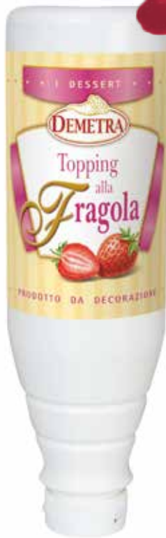
TOPPING ALLA FRAGOLA DEMETRA kg.1