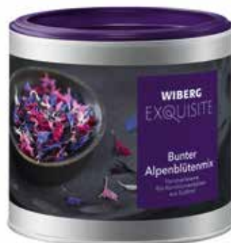
MIX COLORATO FIORI DELLE ALPI WIBERG ml.470