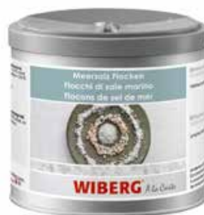
FIOCCHI DI SALE MARINO WIBERG ml.470