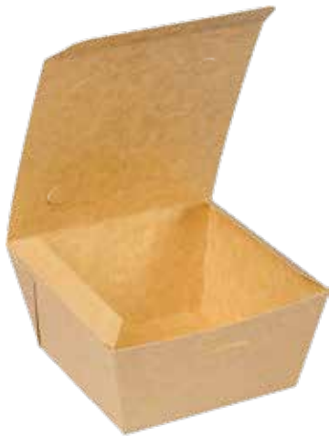
CONTENITORE QUADRATO CON COPERCHIO INTEGRATO (inf.) cm 14x14 | (sup.) cm 18x17.9 x8.6h