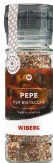
MACININO MONOUSO PEPE PER BISTECCHIE WIBERG Netto gr.70