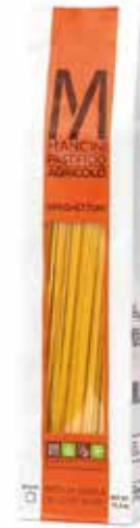
SPAGHETTONI MANCINI kg.1x6