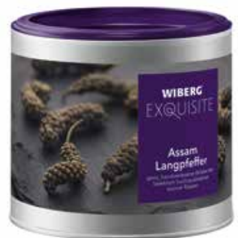
PEPE LUNGO DELL'ASSAM WIBERG ml.470