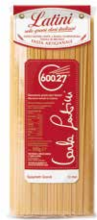
SPAGHETTI GRANDI LATINI gr.500x12