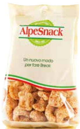
PIG CROCK ALPE gr.250