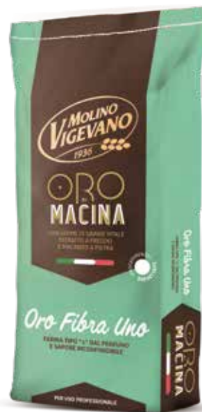
ORO FIBRA UNO MOLINO VIGEVANO Farina di grano tenero tipo "1" con germe di grano w 290/310 Sacco kg.25