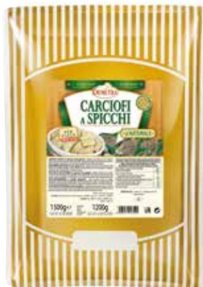
CARCIOFI A SPICCHI AL NATURALE DEMETRA Busta kg.1,5