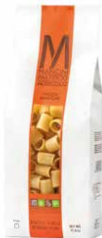
MEZZE MANICHE MANCINI kg.1x6