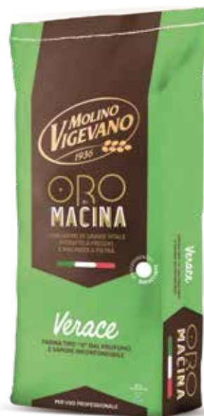
VERACE MOLINO VIGEVANO Farina di grano tenero tipo "0" con germe di grano w 200/230 Sacco kg.25