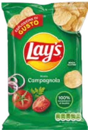
PATATINE CAMPAGNOLA LAY'S gr.44x20