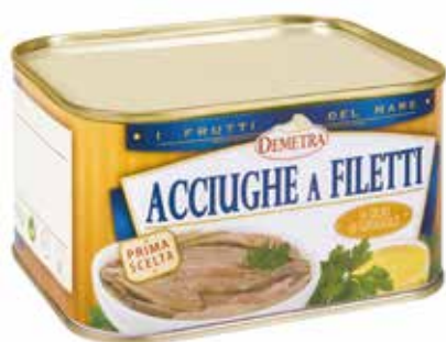
ACCIUGHE A FILETTI PRIMA SCELTA - IN OLIO DI GIRASOLE DEMETRA Netto gr.700